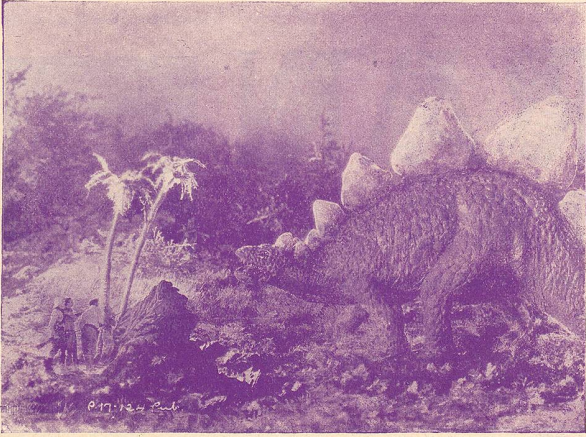
Une scène du „Monde perdu“