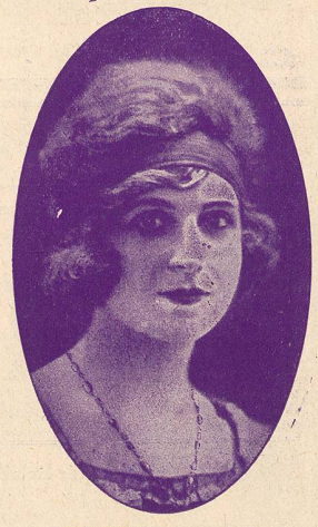
MIRANDA, la charmante divette.