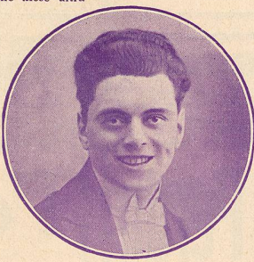
DANCOURT, le compère.

Paris est la ville où l'on s'amuse mais où l'on travaille aussi, c'est ce que veut démontrer ce film. D'abord une petite ouvrière très sérieuse qui se laisse influencer par l'existence brillante d'une vedette et veut goûter du théâtre, mais comme elle est foncièrement honnête elle s'aperçoit qu'elle fait fausse route, heureusement pour elle et pour un élève du grand savant Roulet qui s'était épris d'elle mais qui l'avait délaissée à cause de sa conduite. Le jeune homme travaille à la mise au point d'un moteur inventé par Roulet dont un espion cherche à s'emparer du secret. Un jour celui-ci s'introduit dans la chambre du jeune ingénieur pour s'emparer des documents ; une lutte s'engage entre les deux hommes, mais la machine explose tuant l'espion. Jean, le brave garçon, est tombé dans le vide et se blesse. Il est soigné avec un grand dévouement par la jeune fille qu'il ai-