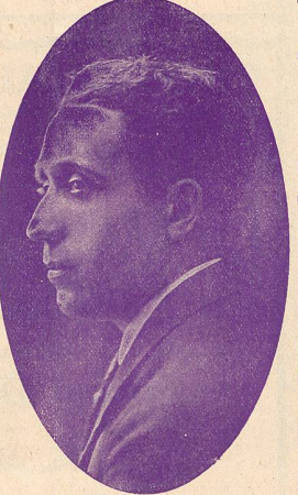
LEBRUN, le désopilant comique.