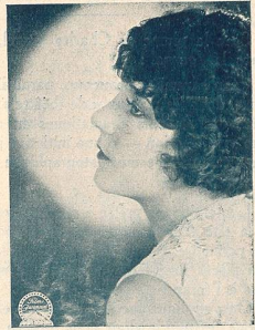
Viola DANA une vedette de la Paramount.

ADMINISTRATION et RÉGIE DES ANNONCES : Avenue de Beaulieu, 11, LAUSANNE — Téléph. 82.77 ABONNEMENT : Suisse, 8 fr. par an ; 6 mois, 4 fr. 50 :: Etranger, 13 fr. :: Chèque postal N° 11. 1028 RÉDACTION : L. FRANÇON, 22, Av. Bergières, LAUSANNE :: Téléphone 35.13