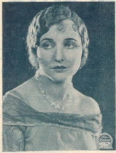
Agnès AYRE une vedette de la Paramount.