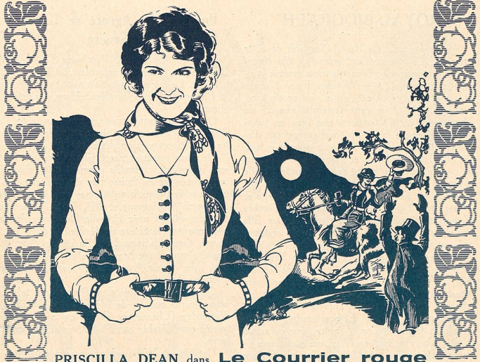
PRISCILLA DEAN dans Le Courier rouge

Qui ne connaît pas au moins de nom cette fameuse pièce de théâtre qui a pour titre : L'Abbé Constantin , tirée par Crémieux et Decourcelle du roman de Ludovic Halévy ? L'histoire est des plus simples : Deux Américaines, Mme Scott et sa jeune cousine Bettina ont acheté un château en France ; notez qu'à ce moment le dollar ne valait que cinq francs. L'abbé Constantin, curé du village, craint de ne plus pouvoir fréquenter le château parce que les nouveaux propriétaires sont protestants, mais les craintes du bon curé ne sont pas fondées car, au contraire, il reçoit une invitation de conserver ses bonnes habitudes. Il présente son neveu aux nouvelles châtelaines qui s'éprennent en coup de foudre de la cousine Bettina. Il règne dans toute cette comédie un esprit de vertu qui tranche sur le dévergondage qui anime