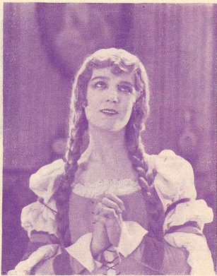
MARY PHILBIN dans Le Fantôme de l'Opéra .