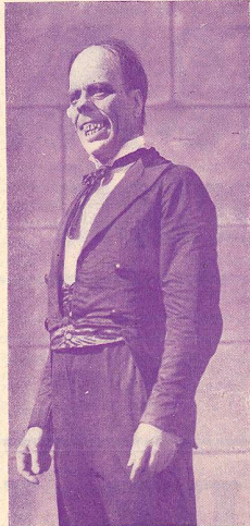
LON CHANEY dans Le Fantôme de l'Opéra .