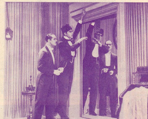
Deux scènes du „FANTÔME DE L'OPÉRA“ qui passe au Théâtre Lumen