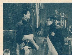
Une entrevue de Napoléon avec le Maréchal Lefebvre