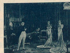
Napoléon et ses sœurs