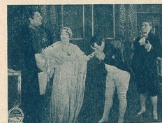
Même scène que N° 2