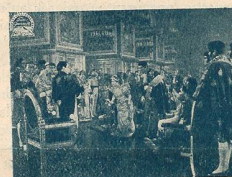
Présentation de M me Sans-Gêne à Napoléon