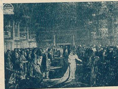
M me Sans-Gêne à la Cour