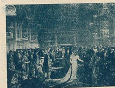
M me Sans-Gêne à la Cour