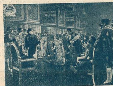
Présentation de M me Sans-Gêne à Napoléon