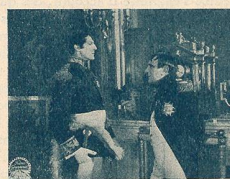
Une entrevue de Napoléon avec le Maréchal Lefebvre