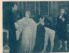
Même scène que N° 2