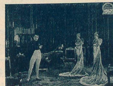
Napoléon et ses sœurs