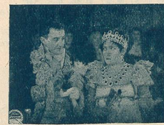
M me Sans-Gêne au Théâtre de la Cour