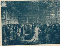
M me Sans-Gêne à la Cour