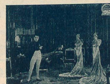
Napoléon et ses sœurs