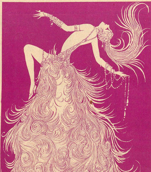
MISTINGUETTE dans son succès Bonjour Paris