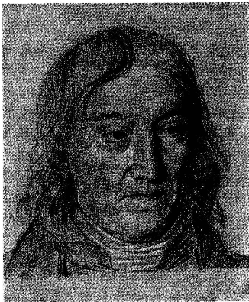
WOLFGANG V. BOLYAI

Beiheft Nr. 11 — Mai 1951 — Verlag Birkhäuser, Basel