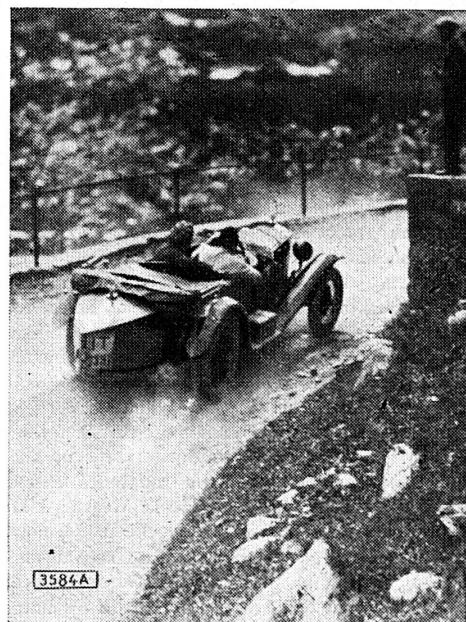
La comtesse Einsidel (Autriche) l'une des gagnantes de la course du Klausen

M me Lüning (Hamburg) pilotant une Fiat au dernier tournant