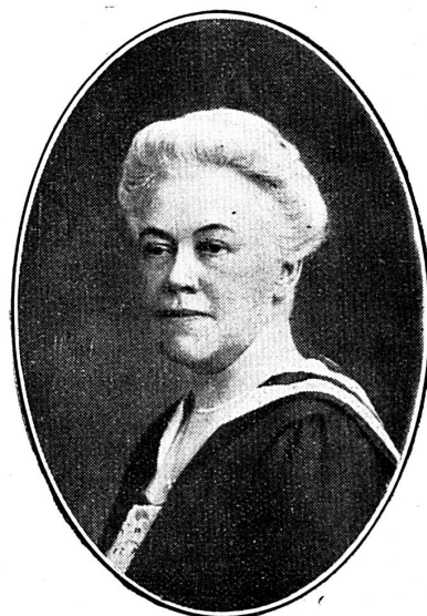
Cliché Jus Suffragii