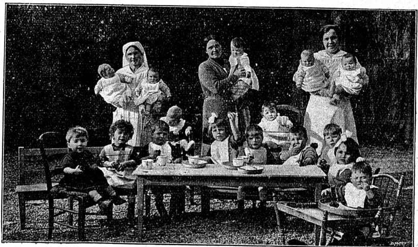
La Pouponnière de "La Retraite"