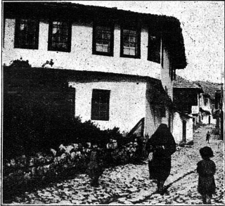
Une maison bosnienne et ses habitantes