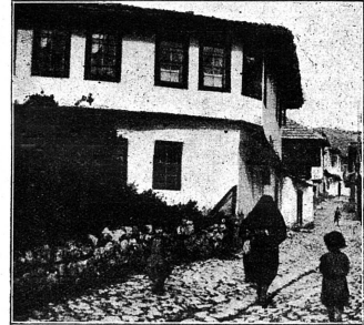
Une maison bosnienne et ses habitantes