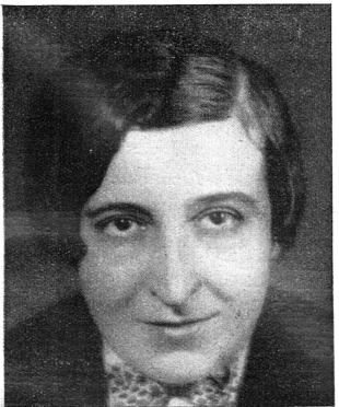
Cliché « Egalité »

— Croyez-vous que la profession de cinéaste offre de l'avenir à la femme ?