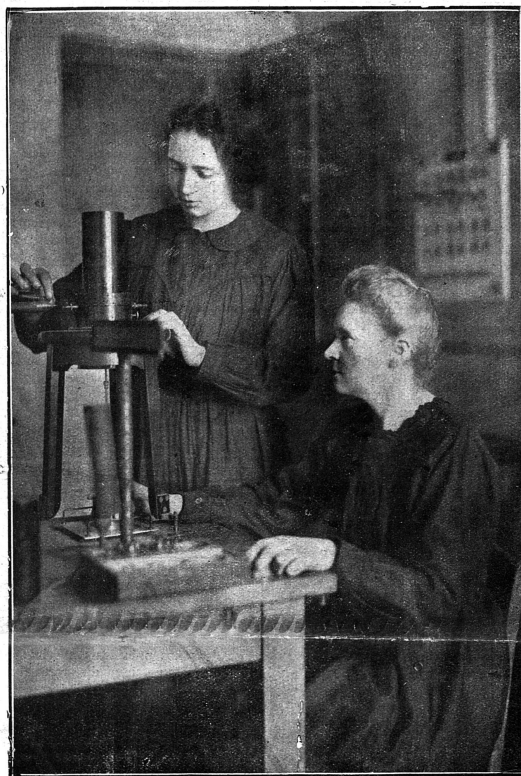
Cliché la « Femme polonoise » Mme CURIE et sa fille Irène, qui collabore à ses recherches scientifiques.