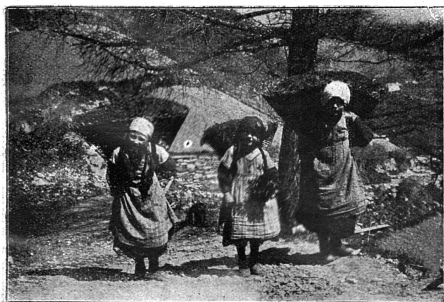
Quand les grand'mères étaient jeunes...