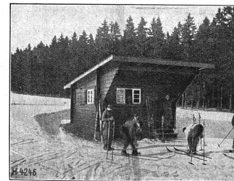
...et en hiver

Ce XII me volume de l' Annuaire a été annoncé en son temps. Il paraît après une éclipse causée par des raisons financières. Saluons son retour en montrant que nous reconnaissons l'utilité de cette publication.