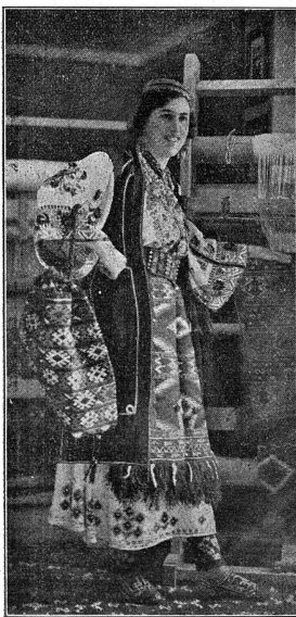
La belle de Zagora

Les jeunes hommes de Dalmatie, quand l'hiver les immobilise au coin du feu, façonnent le bois et le décorent de dessins presque toujours géométriques. De leurs mains sortent ainsi des objets pour leur futur ménage ou des décorations d'instruments de musique, guslas (guitares dalmates), flûtes ou cornemuses. Au bord de la mer, des orfèvres ingénieurs font des pendants d'oreilles lourds et fastueux en enfant de petites perles sans valeur ou de menus coquillages