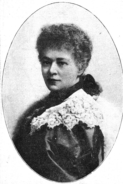
Bertha von SUTTNER l'auteur de « Bas les Armes » à qui va notre pensée en ces journées