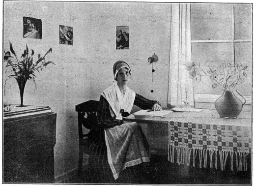
Cliché Conseil International des Femmes.

Les postes de l'enseignement public sont fort recherchés, étant donné les sérieux avantages qu'ils présentent, surtout au point de vue pécuniaire: un gain fixe, le lendemain assuré, puisque les effets de circonstances spéciales (par exemple la crise de 1931) s'y font sentir moins directement que dans l'enseignement privé; une pension de retraite (sauf dans le canton de Neuchâtel où il n'existe qu'un fonds provisoire, et dans celui du Valais); enfin, des vacances régulières qui permettent au maître ou à la maîtresse de « se refaire », ce dont ils ont grand besoin, vu la dépense de forces nerveuses qu'exige cette profession. (A suivre.)