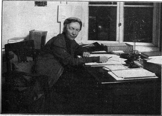
Mlle Kerstin HESSELGREN (Suède)

sénateur, inspectrice du travail, qui préside avec clarté et savoir-faire la V e Commission de l'Assemblée (questions sociales et humanitaires).