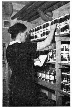
Cliché Ass. suisse pour l'Orientation professionnelle et la Protection des apprentis

Une carrière intéressante, et relativement peu encombrée: celle de directrice de restaurant sans alcool. La même préparation peut d'ailleurs aussi orienter des jeunes filles vers l'économat d'hôpitaux, de cliniques, de sanatoria, d'asiles, etc.