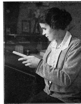
Cliché Mouvement Féministe