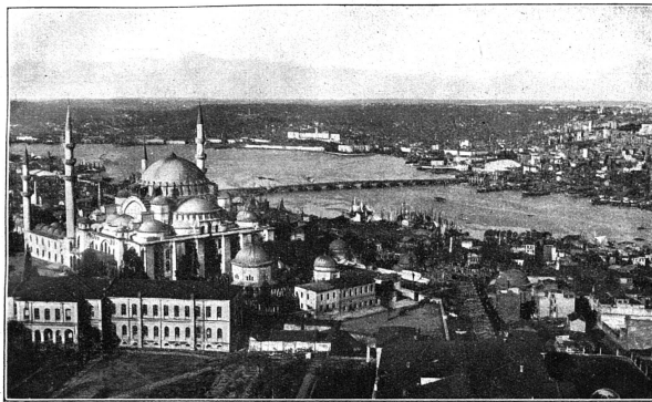
Istanbul, Mosquée de Suleyman et la Corne d'Or

ABONNEMENTS SUISSE . . . . . Fr. 5.— ÉTRANGER . . . . . 8.— Le numéro . . . . . 0.25 Les abonnements partent du 1 er janvier. À partir de juillet, il est différé des abonnements de 6 mois (3 fr.) établis pour la somme de l'année en cours. ANNONCES La ligne ou son espace : 40 centimes Réductions p. annonces répétées