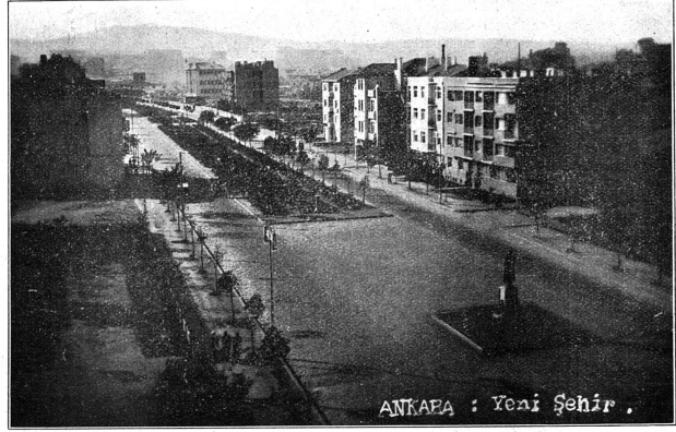
Ankara : La ville moderne