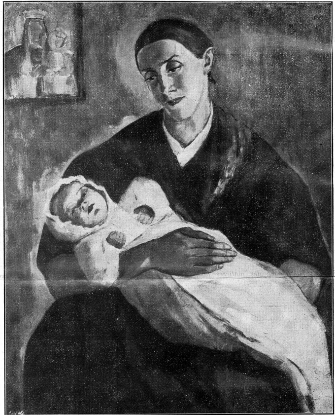
Par Illy Kjaer, artiste autrichienne