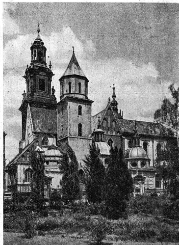
La cathédrale de Cracovie sur le Wawel.

Parmi les rapports des Commissions permanentes, il nous paraît intéressant de mentionner celui de la Commission de Coopération intellectuelle et celui de la Commission d'attribution des bourses internationales. Indépendamment de l'activité exercée selon son but initial, cette dernière s'est préoccupée de venir en aide aux femmes di-