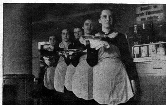
Cliché Le Carillon Service aimable, malgré la suppression des pourboires

Le Foyer de Soutiens ne se contente pas d'abriter les pupilles du Service social pendant une période d'observation, mais il garde aussi les cas difficiles pour une période de rééducation. Il peut recevoir 45 élèves, et avait, à la date de juillet 1934, 6 filles et 14 garçons en observation, 10 filles et 7 garçons en rééducation. Les classes sont mixtes; les groupes d'observation sont réunis dans une classe de sondage, où