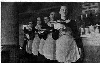
Service aimable, malgré la suppression des pourboires

Le Foyer de Soutiens ne se contente pas d'abriter les pupilles du Service social pendant une période d'observation, mais il garde aussi les cas difficiles pour une période de rééducation. Il peut recevoir 45 élèves, et avait, à la date de juillet 1934, 6 filles et 14 garçons en observation, 10 filles et 7 garçons en rééducation. Les classes sont mixtes; les groupes d'observation sont réunis dans une classe de sondage, où