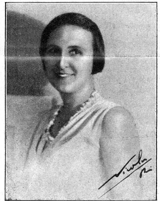
Cliché Mouvement Féministe