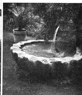
Cliché et photos Berna. La belle fontaine de la Wegmühle.