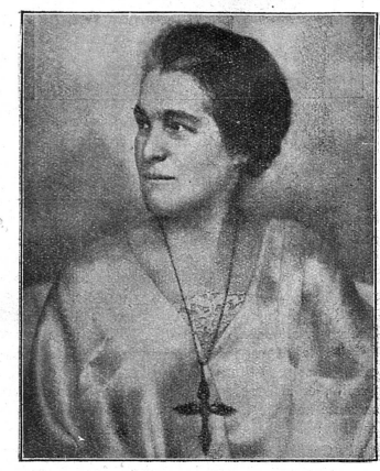
Mrs. M. CORBETT ASHBY

ABONNEMENTS SUISSE..... Fr. 5.- ÉTRANGER... 8.- Le numéro... 0.25 ANNONCES La ligne ou son espace : 40 centimes Réductions p. annonces répétées Les abonnements partent du 1 er janvier. À partir de juillet, il est édité des abonnements de 6 mois (3 fr.) valables pour la semaine de l'année en cours.