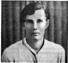
Barbara WOOTTON

On le voit, la conférencière que nous avons eu le privilège d'entendre à La Haye est une économiste de premier ordre. Mais à côté de sa science si sûre, et si personnelle, dirai-je, parce que si réfléchi et si solidement étayé sur ses recherches et ses réflexions, ce que nous, profanes, apprécions aussi chez Mrs Wootton, c'est son incomparable talent d'exposition. Avec elle, l'économie politique, la statistique, la sociologie, la politique ne sont jamais ni arides ou abstraites, mais au contraire lumineuses de clarté, et palpitantes de vie. On l'écoute comme on entendrait une belle histoire, incroyablement vraie, qui plonge ses racines dans notre vie de tous les jours, et dont les enseignements nous soulèvent au-dessus de nous-mêmes en nous aidant à comprendre la valeur pour la communauté des phénomènes les plus courants de notre existence journalière. Et les deux noms de maîtres qui viennent tout naturellement à notre pensée, en évoquant les dons intellectuels de Barbara Wootton, montreront bien comment nous n'hésitons pas à la comparer avec