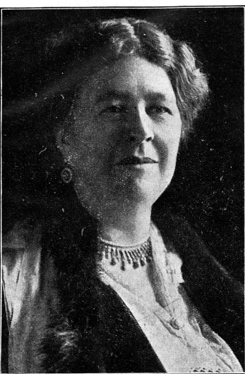
Cliché Jus Suffragii

Pensée de la semaine de l'Eglise écossaise de Nairn (Invernesshire).