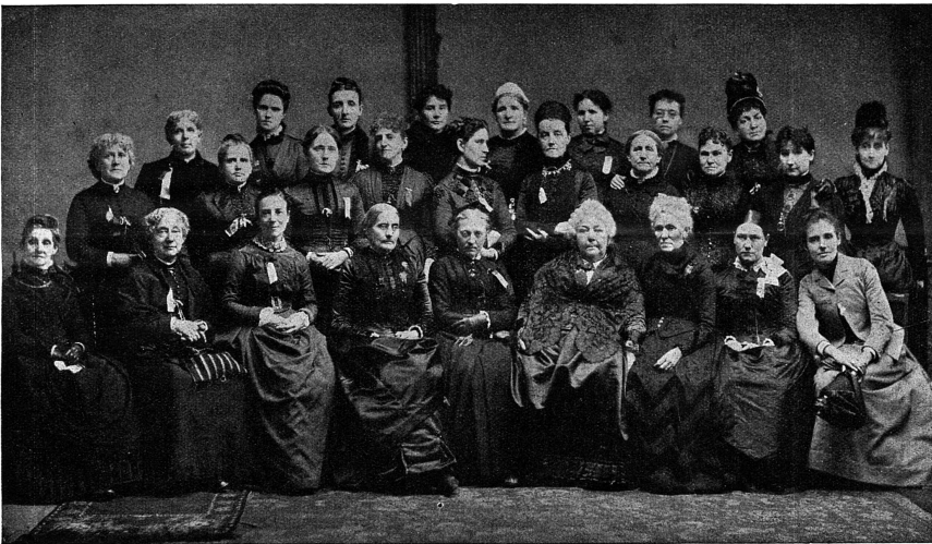
La fondation du Conseil International des Femmes en 1888