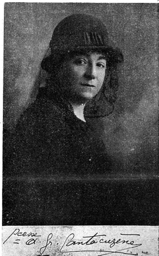
La princesse Cantacuzène, à l'activité de laquelle est due pour une bonne part le succès des femmes roumaines.

Dans le monde en désarroi dans lequel nous vivons, il se produit parfois des événements à l'allure nettement paradoxale. Du nombre est celui dont la nouvelle vient de nous parvenir par un message de la princesse Cantacuzène: la reconnaissance du droit de vote aux femmes roumaines!