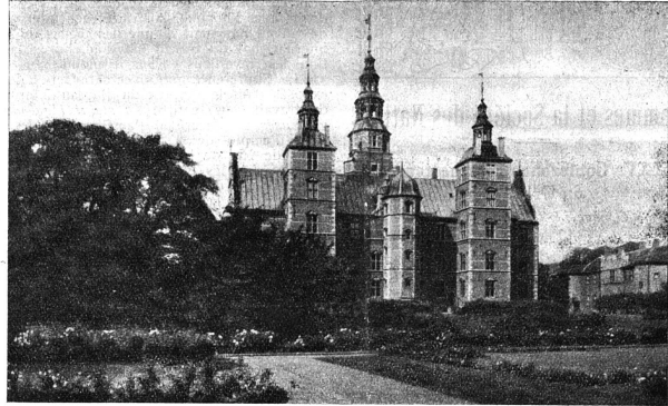
Le château royal de Rosenborg à Copenhague