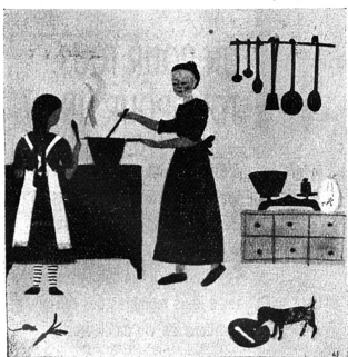
brochure „Du Schweizerfrau“ Olichés Office suisse des professions féminines, Zurich.