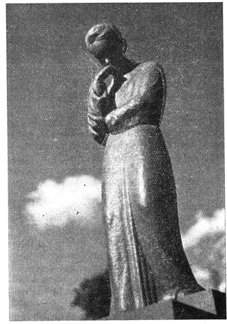
La statue de Marie Curie à Varsovie sans doute en ruines aujourd'hui...