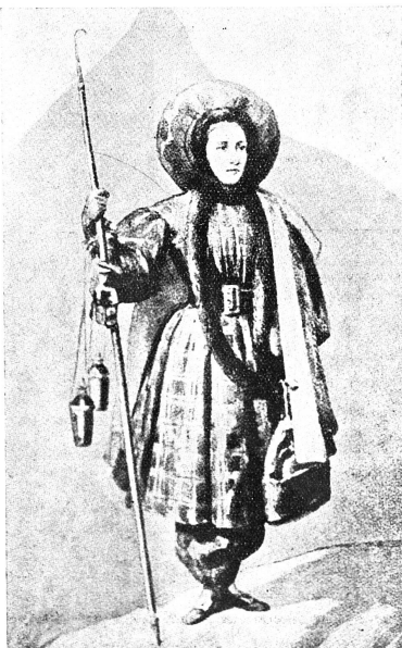
Henriette d'Angeville, « la fiancée du Mont-Blanc », en costume d'alpiniste.