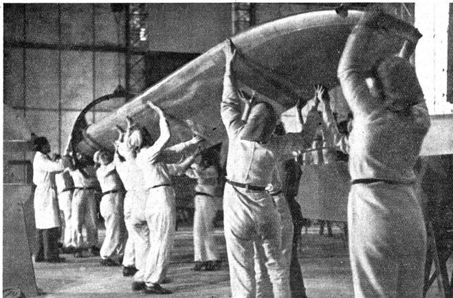
Cliché Mouvement Féministe.