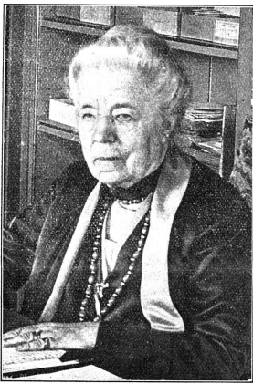
Selma Lagerlöf (1858 - 1910)

Il est sans doute peu d'auteurs contemporains, tant masculins que féminins, dont le nom soit plus connu, l'œuvre plus lue ou traduite en un plus grand nombre de langues, plus abondamment commentée ou évoquée, que ce ne fut le cas pour la grande romancière suédoise, qui vient de s'endormir paisiblement, chargée d'honneurs et de gloire, dans cette maison familiale de Märbacka, dont sa renommée avait fait un lieu de pèlerinage quasi