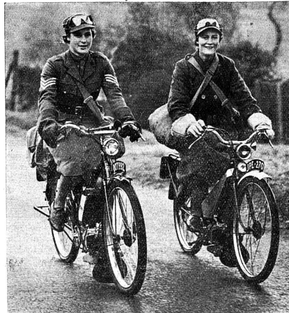
Deux motocyclistes du Service auxiliaire territorial féminin.

R.: Oui: deux vieillards et cinq enfants, dont