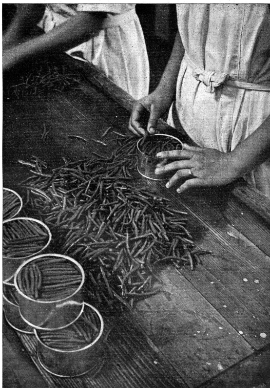
Une industrie de l'alimentation

La collaboration féminine au travail national