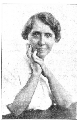
Miss Marg. HANNA Consul des Etats-Unis à Genève de 1936 à 1938.