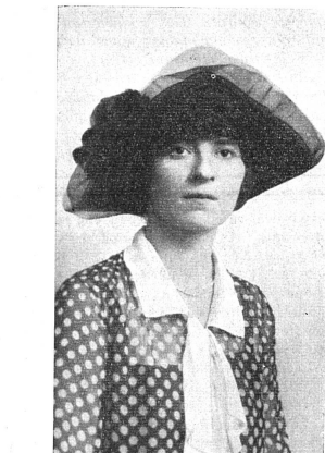
Cliché Mouvement Féministe Miss Lucile ATCHERSON Vice-Consul des Etats-Unis à Berne, (1922) puis à Panama.