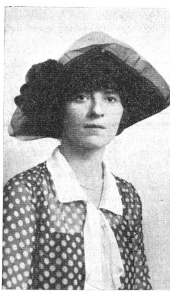
Miss Lucile ATCHERSON Vice-Consul des Etats-Unis à Berne, (1922) puis à Panama.