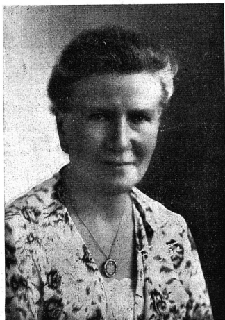
La plus récente photo de la rédactrice

de les avoir toujours loyalement défendues sans compromission ni opportunisme ? Avoir derrière soi trente ans de franchises et belles batailles, sans y avoir émué ni son ardeur ni son optimisme, ce n'est pas rien ; et si nos adversaires nous objectent que le triomphe n'a pas précisément toujours couronné ces combats ! ne pouvons-nous pas leur répondre, nous inspirant d'une parole célèbre, que ce qui importe, « ce n'est pas le succès, mais l'effort » ?