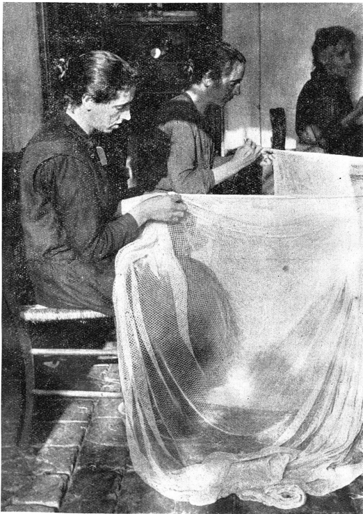
Cliché... Die Frau in Leben und Arbeit