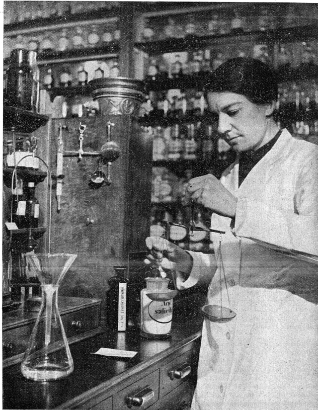
Cliché «Dù Schweizer Frau».

Ceux de nos lecteurs et lectrices qui ne conservent pas la collection du «Mouvement», et ils sont certainement nombreux, voudraient-ils nous rendre le service de retourner à l'adresse de notre Rédaction, Crêts-de-Pregny, Genève, le dernier numéro, paru avant celui-ci, soit celui du 10 juillet 1943, N° 643, le tirage s'en étant trouvé tout à coup insuffisant? Merci d'avance à tous.